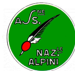
Gruppo di Cossato